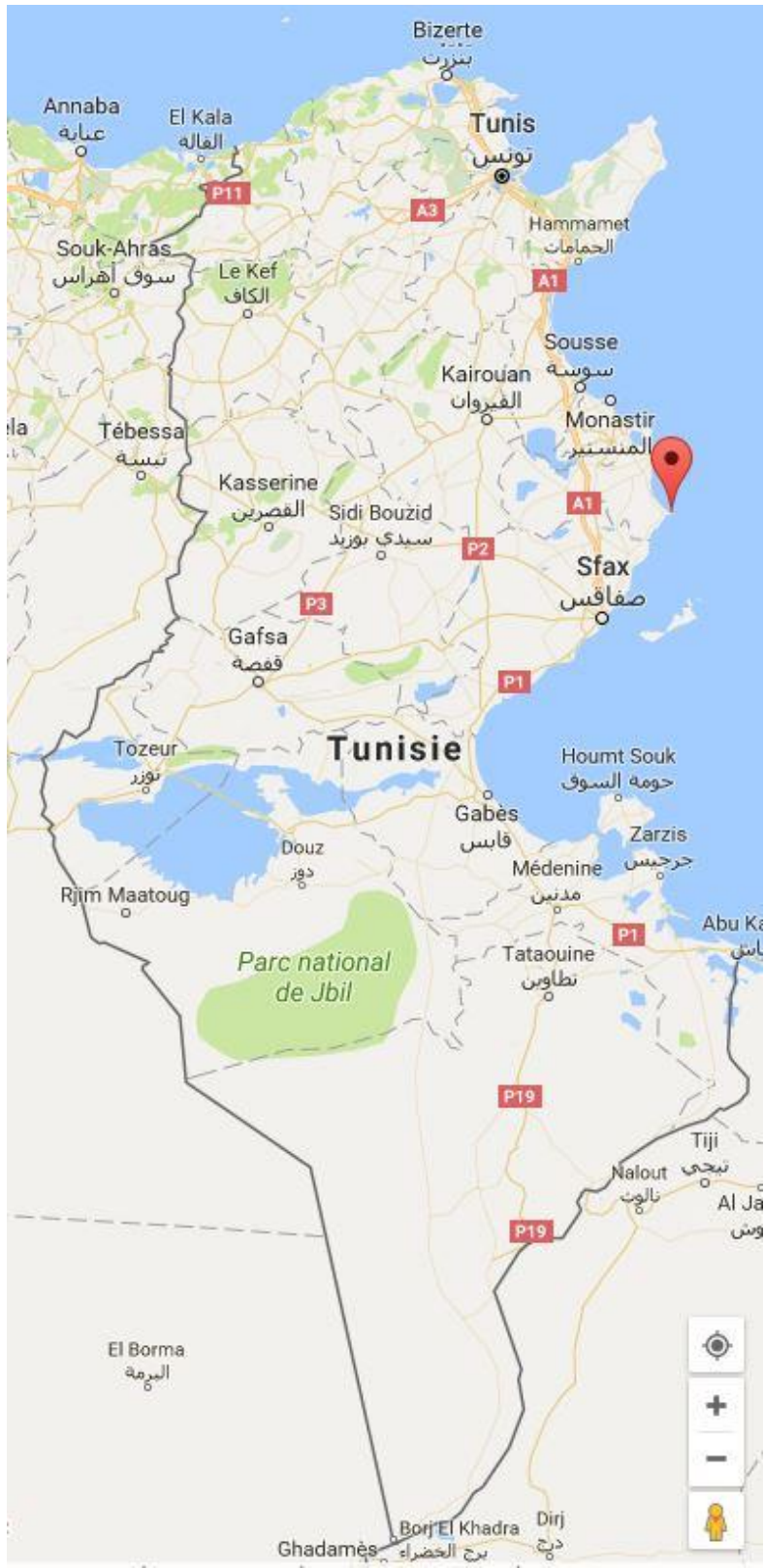
Localisation en Tunisie